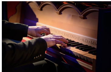
Foto ©: Klaudyna Schubert, Château du Clos Lucé – Léonard de Serres, Les Nuits de Septembre Liege, Artur Rubinstein Philharmony in Łódź, Bucharest Early Music Festival

slawomir@zubrzycki.art.pl tel: +48 601 640 831